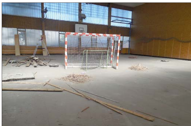
Kam zmizelo dřevo z tělocvičny?