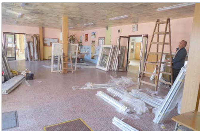
Týden před začátkem školy