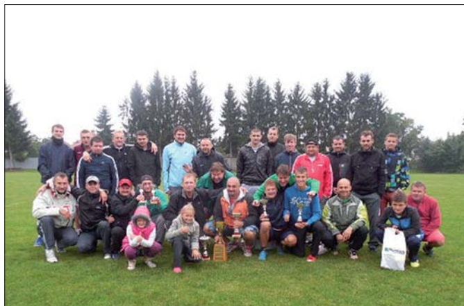
10. ročník Posvícenský sedmiboje