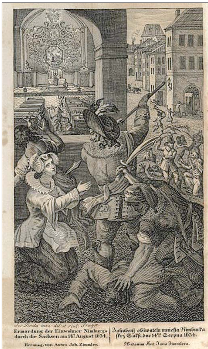
Plení Nymburka, z knihy J. A. Zimmerera Die Zerstörung Nimbürgs

Jak se situace projevila v okolních vesnicích, můžeme jmenovat dle pozemkových knih: V Kostomlátkách byla polovina usedlostí neobydlena a jejich pole neobdělávána a původní majitelé zcela vymizeli. Kostomlaty byly zničeny a bezprostředně po válce byly osídleny pouze 4 statky, dalších 8 pustých nebo zbořených. Vesnice byla zpustlá ještě do počátku 18. století, kdy se začíná opět pomalu oživot. Na Lánech nezůstal jediný původní hospodář, částečně proto, že zde žilo mnoho evangelíků, kteří museli prchnout ze země. Po válce bylo zde obýváno 19 domů, zbylé byly pusté. Hronětice měly 10 usedlostí a 3 pusté dvory. Neobdělávaná půda byla rozdělena mezi nové osadníky, z nichž se někteří usadili v Šibicích nebo později na Vápensku (založeno 1709). Stejně zpust-