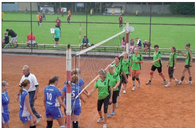
Volejbalistky vyhrály oba zápasy KRAJSKÉHO PŘEBORU.